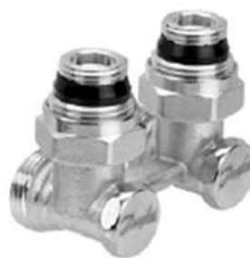
RLV-KS угловой с присоединением к отопительному прибору G ½ и G ¾