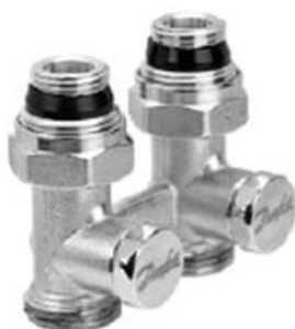
RLV-KS прямой с присоединением к отопительному прибору G ½ и G ¾