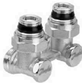
RLV-KS угловой с присоединением к отопительному прибору G ½ и G ¾