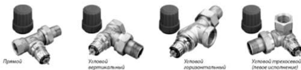
Рисунок - Клапаны терморегулирующие типа RTR-N

Клапаны терморегулирующие типа RTR-N предназначены для применения в двухтрубных насосных системах водяного отопления. Не предназначены для контакта с питьевой водой в системах хозяйственно-питьевого водоснабжения. Клапаны терморегулирующие типа RTR-N оснащены встроенным устройством для предварительной (монтажной) настройки его пропускной способности в рамках следующих диапазонов: